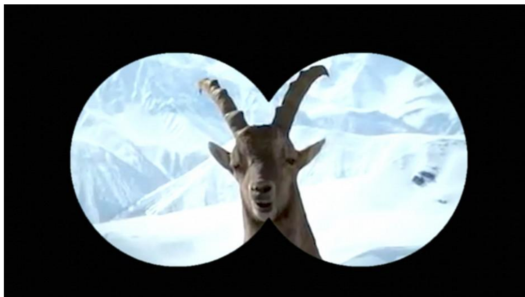
Übt sich in Bündnerdeutsch: der junge Steinbock «Jürg».

Im Video «Der Jürg üabt» nimmt ein neuer Kollege der bekannten Steinböcke Gian und Giachen Unterricht in Bündnerdialekt: Die private Viralkampagne für Graubünden gratuliert damit Jürg Schmid zur Wahl zum neuen Präsidenten von Graubünden Ferien.